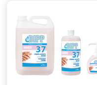
DIPP N° 37