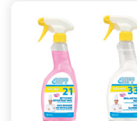
DIPP N° 21 & 33