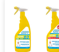
DIPP N° 02