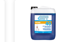
DIPP N° 40