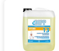
DIPP N° 13