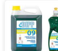
DIPP N° 09