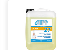
DIPP N° 27