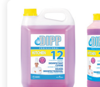
DIPP N° 12