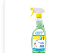
DIPP N° 31