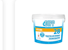
DIPP N° 28