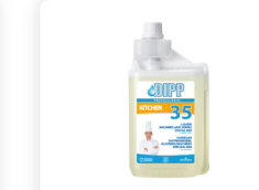
DIPP N° 35