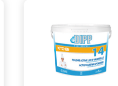
DIPP N° 14