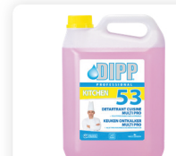
DIPP N° 53