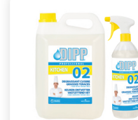
DIPP N° 02