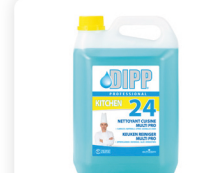
DIPP N° 24